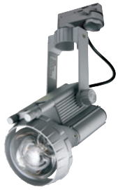
RUTIL BETTA PAR/G