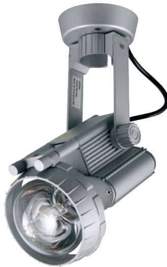
RUTIL BETTA PAR