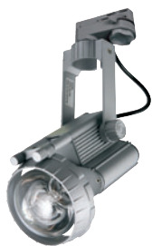
RUTIL BETTA PAR/G